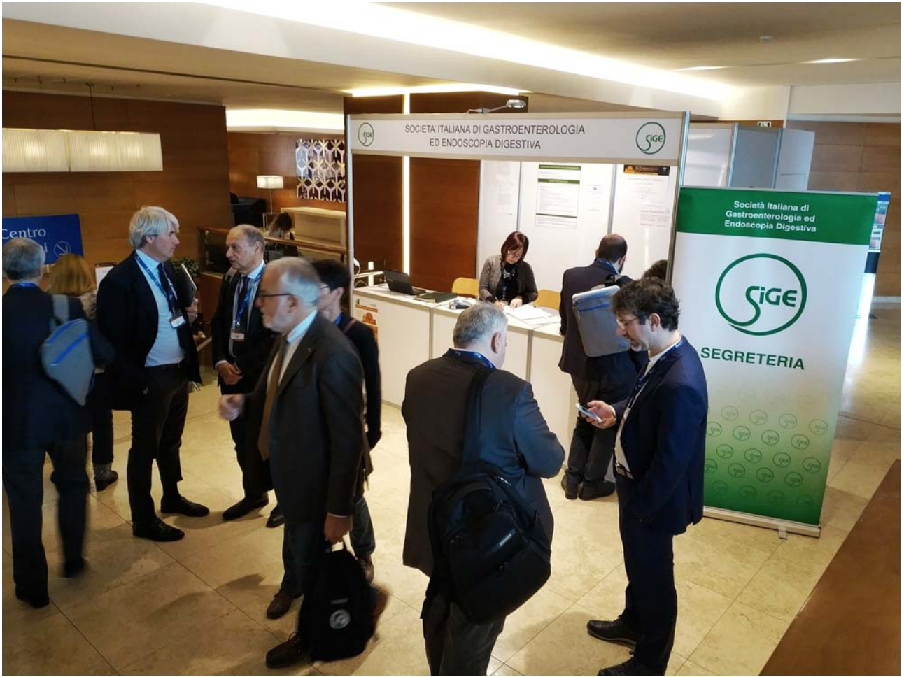
XXV CNMD, Stand SIGE