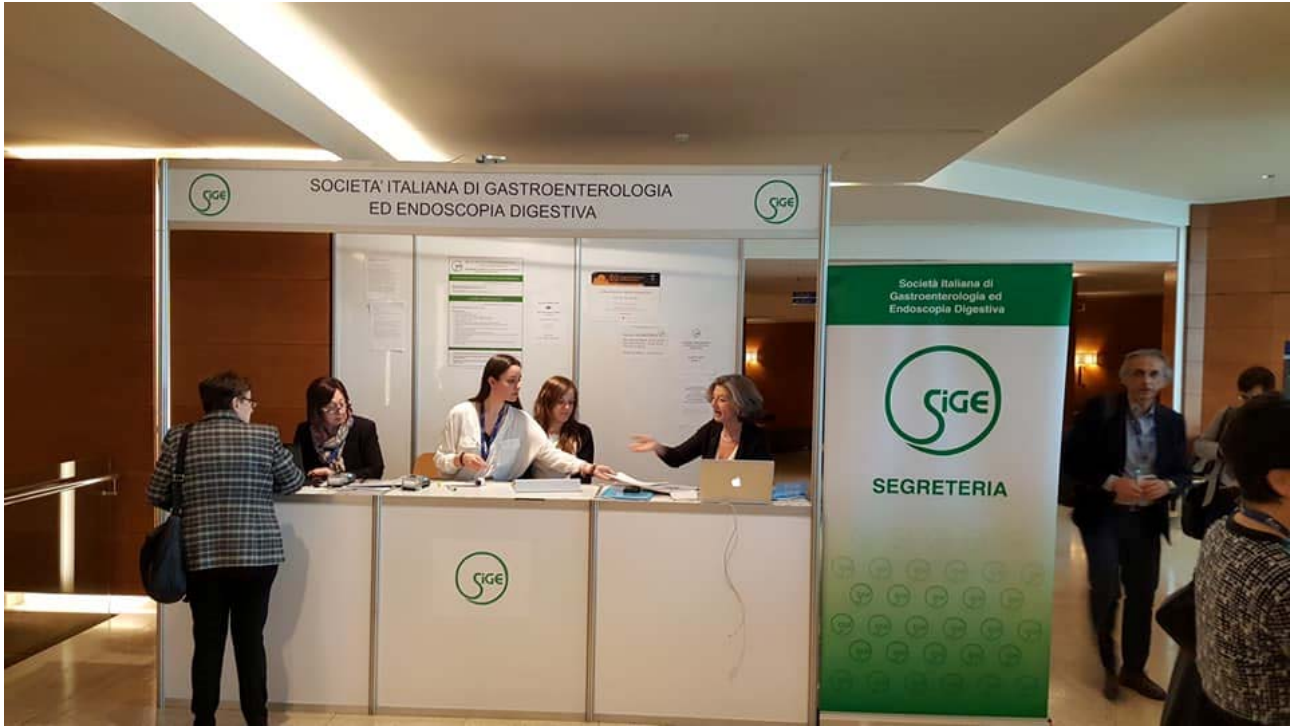
XXV CNMD, Stand SIGE