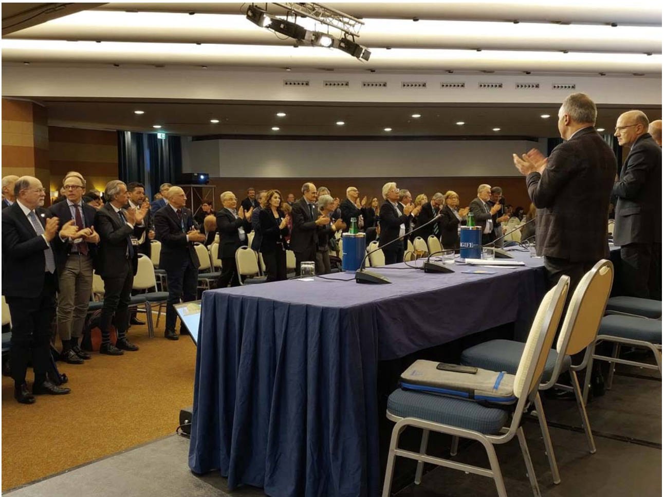
Inaugurazione XXV CNMD