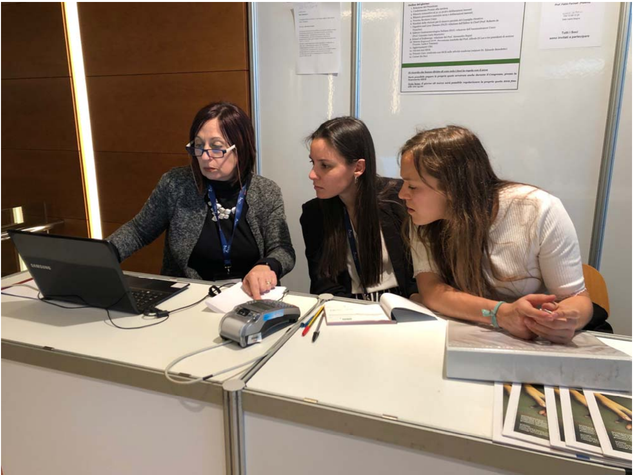
XXV CNMD, Stand SIGE