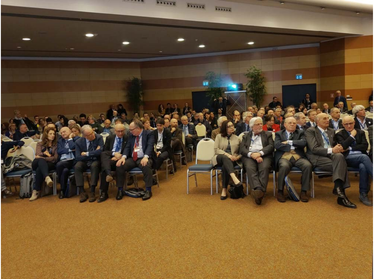
Inaugurazione XXV CNMD