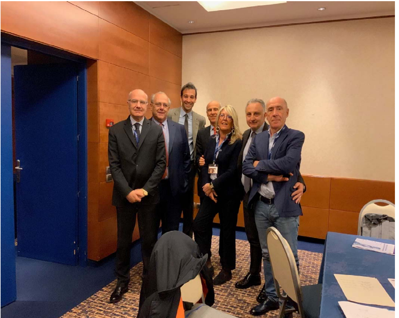
Firma statuto FiSMAD