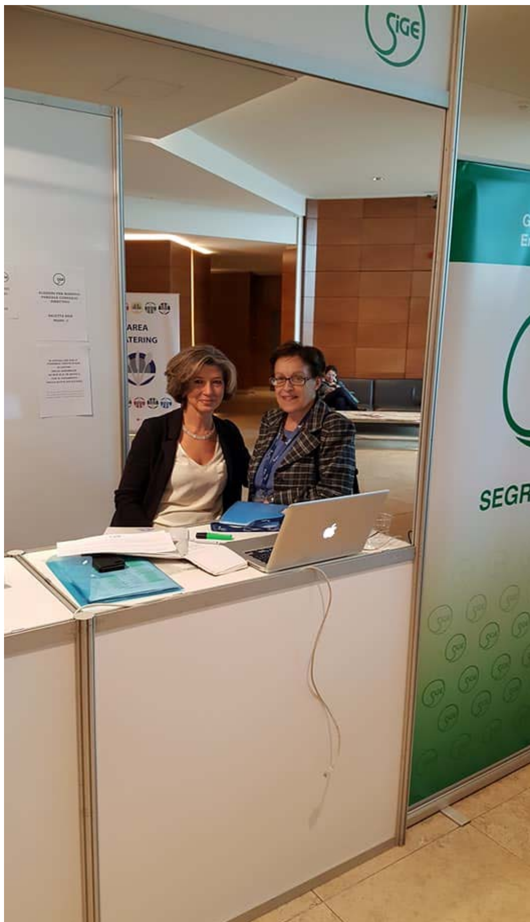
XXV CNMD, Stand SIGE